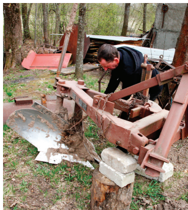
SIA "Kālnienas sparģelis" zemes apstrādei izmanto pašu izgatavotu arklu

Ja zaļo dzinumu sparģeļus ir plānots novākt ar rokām, tad stādīšanas dziļumam jābūt tādām pašām kā balto dzinumu ievākšanai, bet dobes platumam tādām, lai dzinumus var aizsniegt un nogriezt, tātad ne platākam par 1,2 m, optimāli – ap metru. Rindstarpai ir jābūt vismaz 50–70 cm. Balto sparģeļu dzinumiem dēstus stāda 20–30 cm dziļās vagās, 40–50 cm attālumā vienu no otra. Attālumam starp vāgu centriem jābūt 1,2–1,4 m. Ja rindstarpas plānots apstrādāt ar tehniku, tad attālumam jābūt 1,6 m un vēl vairāk atkarībā no traktora izmēriem. Pēc iestādīšanas virs stāda asniem ir jābūt 10–15 cm augsnes slānim.