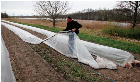
SIA "Kalnienas spargēlis" pirmā raža tiek izaudzēta tunēļos

Pirmajā gadā pēc iestādīšanas vasarā vairākkārt jāveic augsnes virskārtas iridināšana un regulāri jāravē nezāles. Nepieciešams arī papildmēslojums, izmantojot gan komplekso, gan slāpekļa mēslojumu. Pavasaros,