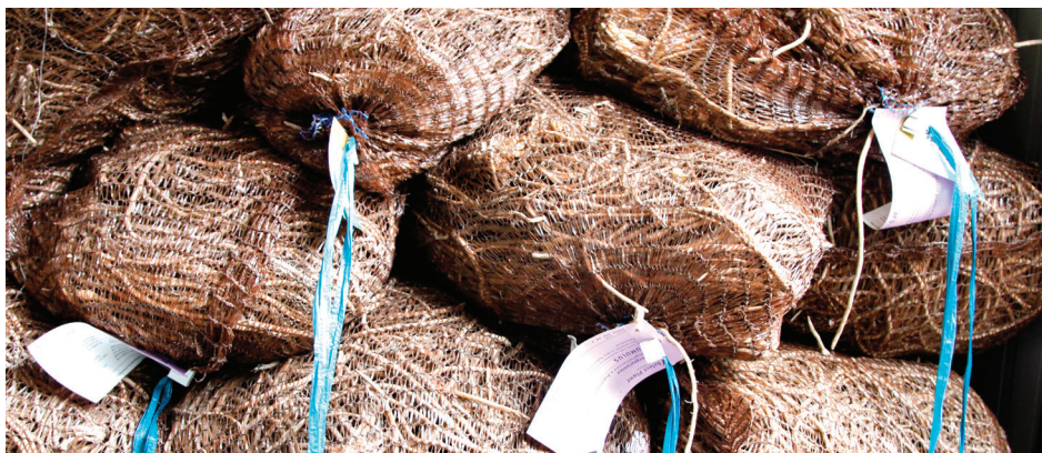
Divgadīgi stādi no Goertz sparģeļu audzētavas Holandē

Sparģeļu sēklas ir apaļas, ar biezu apvalku, tās ievāc rudē, vēlams – tikai no šķirnēm. Sausas sēklas martā izsēj bagātinātā kūdras substrātā. Nodrošinot +16 °C temperatūru, tās sadīgst 1-2 nedēļās. Aprīļa beigās vai maija sākumā sadīgušos dēstus izstāda dobē ar aprēķinu, ka tie konkrētajā vietā varēs augt divus gadus. Dobē augsnei ir jābūt dziļi iekoptai – līdz 60 cm, lai varētu attīstīties spēcīga sakņu sistēma. Pēc diviem gadiem dēstus izstāda paliekošā vietā, un vēl pēc gada varēs ievākt pirmo sparģeļu ražu. Nelielos daudzumos stādus var nopirkt arī Latvijā. Trīsgadīgu sparģeļu stādu cena ir vidēji 1,20 eiro, mazāku – 0,80 eiro (minimālais daudzums – vismaz desmit stādu). Lielākus daudzumus nāksies pasūtīt ārpus Latvijas – no Vācijas vai Holandes, līdz ar to jāpierēķina atvešanas izdevumi, toties kvalitāte būs laba. Pasūtot stādus Vācijas stādaudzētavās, to cena būs vidēji 50 centi par stādu.